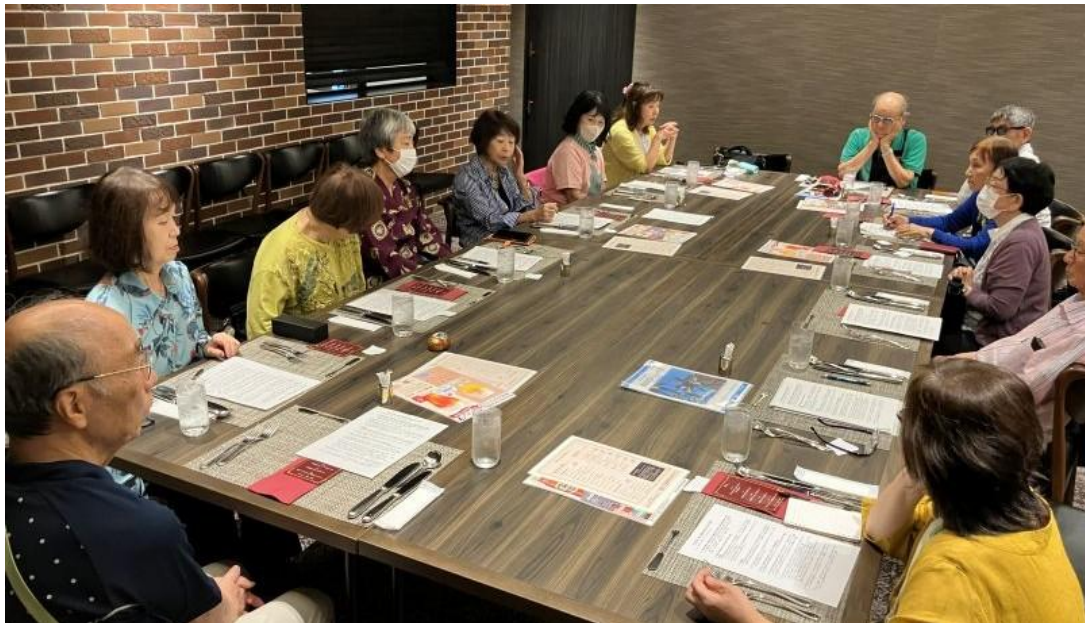
東海支部グループが、いかに楽しく身軽に活動できるのかも議論しています。