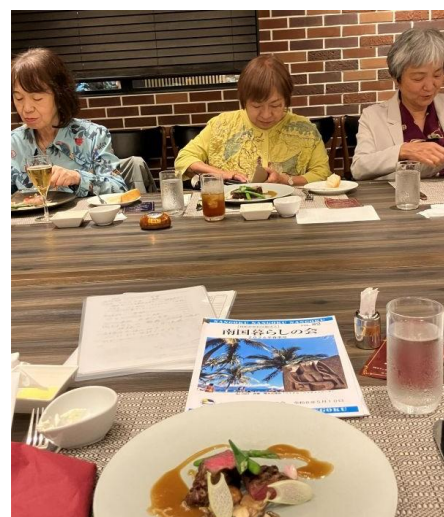
キンメダイ・知多牛など食べながら・・・。電子版の会報も見てくださいね！！