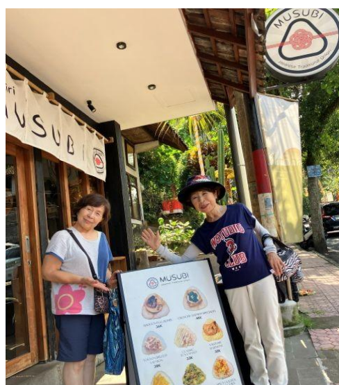
MUSUBI Japanese レストランで味噌汁とおかずセット、ふんわりと握り具合も絶妙！