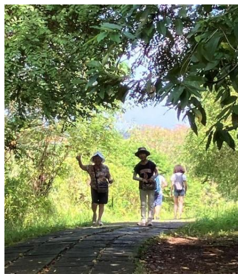
ウブド王宮から1時間半程度のハイキングコース。尾根上の集落には素敵なカフェも並んでいます