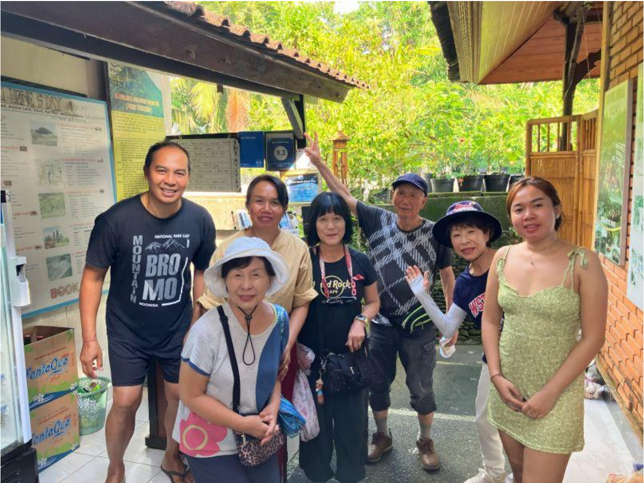
ウブドで家族経営の Ayu Homestay のスタッフと、朝食付きで 5,000 円前後

さて、バリ島滞在組も三々五々帰国されていきましたが、6月下旬に有志5名、7月上旬に2名が、それぞれ4泊5日でウブドへ滞在しました。毎晩、芸能鑑賞や緑豊かな田園地帯のハイキングを楽しみ、ウブド在住の現地旅行会社（APA?情報センター：地球の歩き方にも掲載）のワヤンさんにガイドをお願いして世界遺産のジャティルウイの棚田とブラタン湖に浮かぶ寺院など日帰で観光を楽しみました。サヌールへ戻った後は各自のスタイルでバリ島の南国暮らしを過ごしていました。