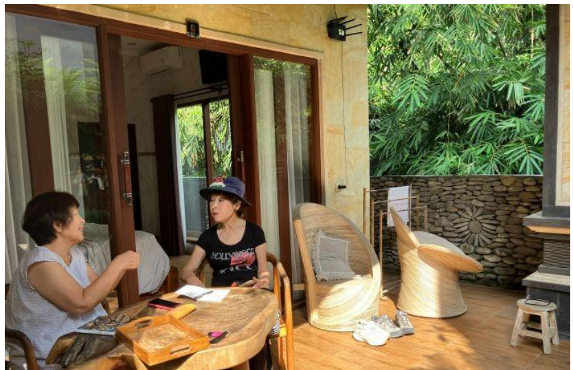
朝食は5種類程あるので毎日選択。部屋まで運んでくれるのでテラスでモーニング