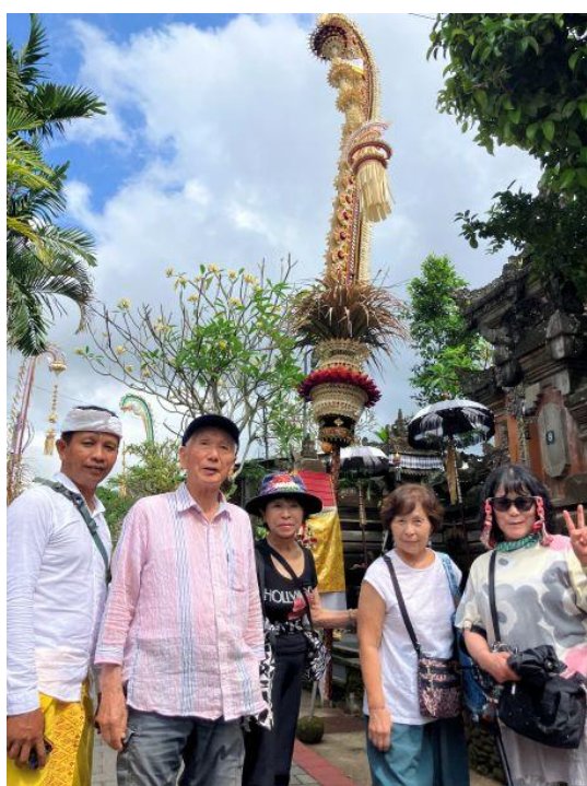
お盆行事に欠かせないペンジョール