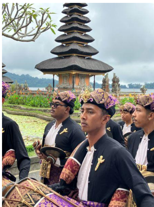
高原のブラタン湖 湖に浮かぶ寺院とパレード