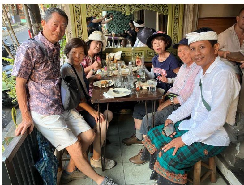
芸能鑑賞とともに重要なのが食事。★ビンタンビールだけは欠かせません