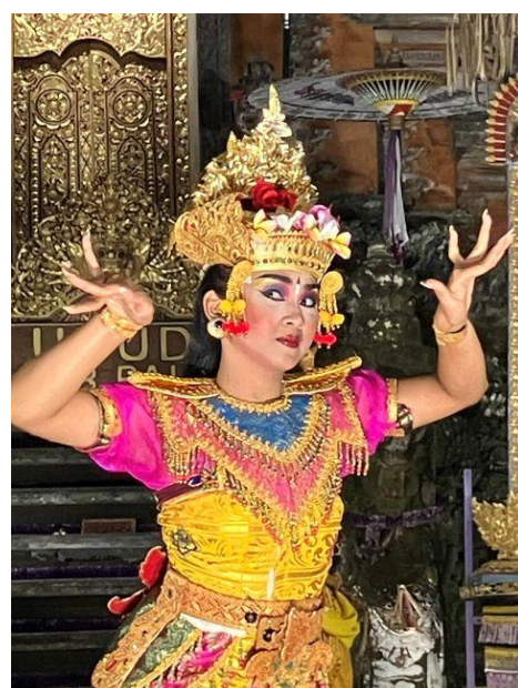
ウォーターパレスでレゴンダンス鑑賞 終了後は気軽に記念撮影に応じてくれます