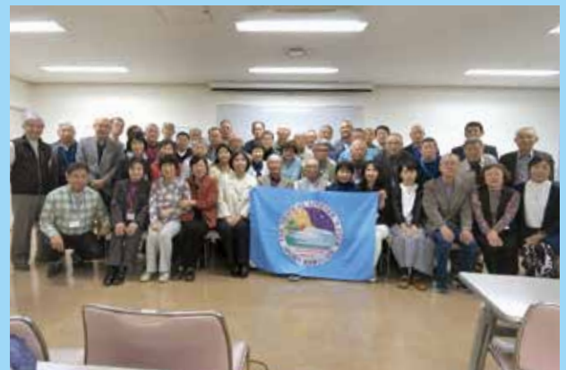
関西支部 サロン会