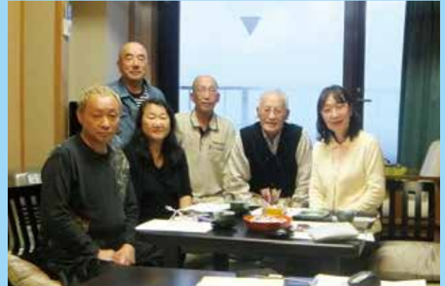
東北支部 サロン会&懇親会