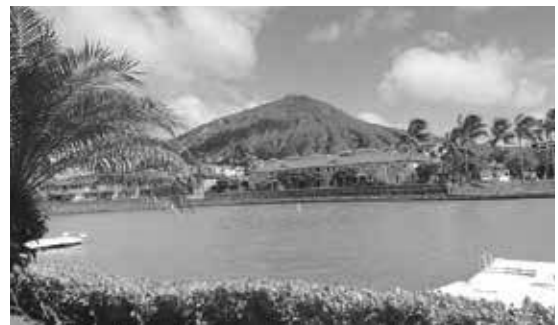
我が家から見える緑のココクレーター

ハワイは1年中快晴の青い空に恵まれているというイメージがあるかも知れませんが、実際には雨季(10月から4月)と乾季(5月から9月)の2つの季節があります。今年はその乾季にかなり雨が降りました。実際、雨季がいつまでも終わらず、乾季がなかなか始まらないなと感じ、6月にみなさんがいらっしゃるまでに乾季が始まるのかどうかヤキモキしました。その証拠が例年なら茶色いはずのダイヤモンドヘッドやココヘッドが7月で