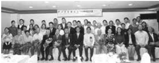
三輪領事もご出席頂き開催された100周年記念式典