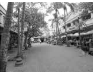
「チャイナタウン」内の遊歩道

私たちのLSのポリシーは、自炊がメインなので、スーパーには良く買い物へいきました。市場やスーパーへ行くと、その国の様子が良く分かりますのでとても良いですね。