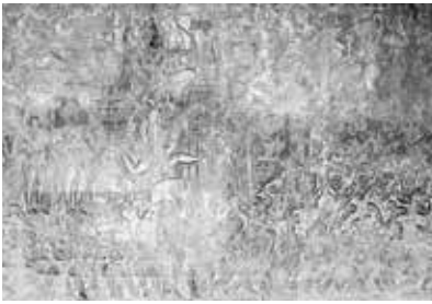
第一回廊のマハーバーラタ