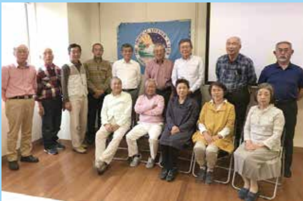
九州支部 サロン会