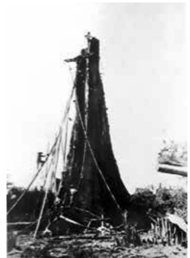
ラワンの木を伐採し畑に

が難しく、雨が多いと根が腐り日照りが続くと葉が紙のようになり、いったん火が着くとあっという間に何ヘクタールのアバカが灰になってしまいます。また熱帯病のマラリアに罹ったり現住民に襲われたりと約30%、4,000名近い犠牲者をだしています。必死に1年間働き続け栽培したアバカが一瞬にして灰になり、身近な父や母を亡くして涙を流しても働くことはやめませんでした。こんな苦勞を乗り越え漸く1920年代後半より好況が