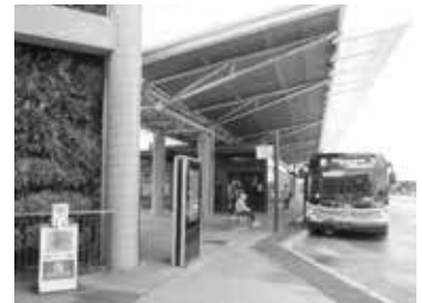
「カリヒ TC」のターミナル

「カリヒ TC」に着くと、その着いたホームに小さな事務所があり、そこが「優待バス事務所」になっていて、これも分かり易いですね。私たちが行った時も10人くらいが並んでいましたのですぐ分かりました。