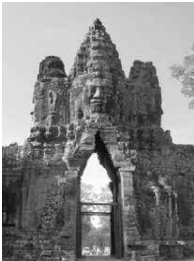
アンコール・トム南大門