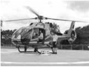
ヘリコプターで上空より滝の見学