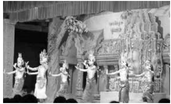
アプサラ・ダンス・ショー