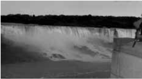
滝のライトアップ

アガラの滝と聞いていたけどびっくりでした。夜景の美しかったこと、広大なナイアガラがライトアップされて美しかった。