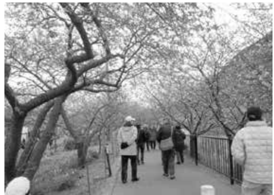
河津川沿いに続く桜並木

今年は寒い冬だったことから例年は満開の時期なのに、まだ三分から五分咲きといったところでした。それでも、この日も平日にもかかわらず桜の並木は外国人観光客を含め大勢の人で混んでいました。