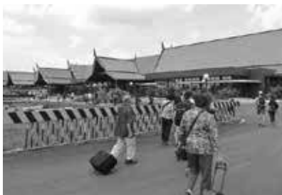
シムリアップ空港

マネーチェンジはカンボジアの場合、現地貨幣リエルの種類が多いのでUSドル紙幣でO.K.との事で現地通貨へは変更しませんでした。