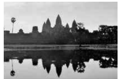
朝のアンコール・ワット

しかし150年前にはその存在すら分からず、その後フランスの博物学者が発見する迄ジャン