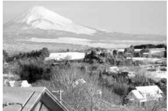
函南町の別荘から富士山を望む

ここ函南町の丘陵地にある別荘地からは北西に白雪の秀峰富士山を望み、南西には三島、沼津の街と青い駿河湾を見下ろすことができ