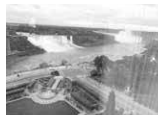
アメリカ滝とカナダ滝