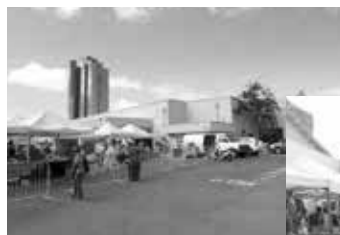
「カカオファーマーズ・マーケット」