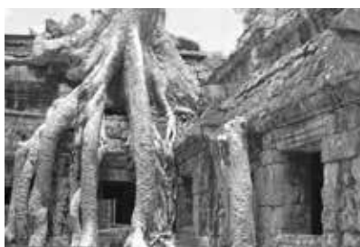
タ・ブロームの榕樹