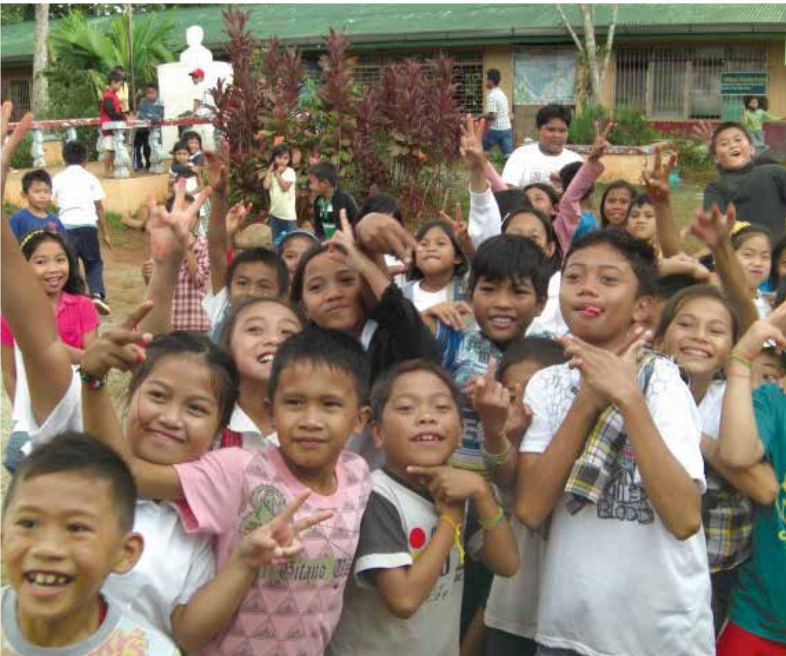
No.1473 タバオ、山間僻地の子供たち