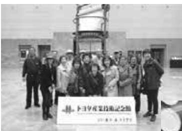
トヨタ産業技術記念館

2-3. 4月17日(火) 13名が参加して平日サロン会が開かれました。トヨタ産業技術記念館を自由見学し、レストラン“ブリックエイジ”でランチ後、ノリタケの森へ移動。ノリタケの森ミュージアムを自由見学しました。