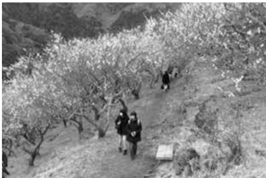
湯河原駅から15分湯河原梅林