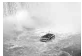
滝の下まで船で移動