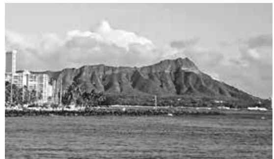
緑のダイヤモンドヘッド

今年の日本は台風や自然災害に見舞われた年でしたが、オアフ島は大きな被害はまぬがれましたが、ハワイにも2つの大型ハリケーンが次々と来ました。これは余り無いことのようにです。まだハリケーンシーズンは終わっていない(6月1日-11月30日)ので、もう来ないで欲しいものです。