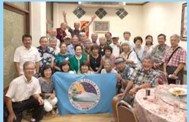
チェンマイ支部 サロン会