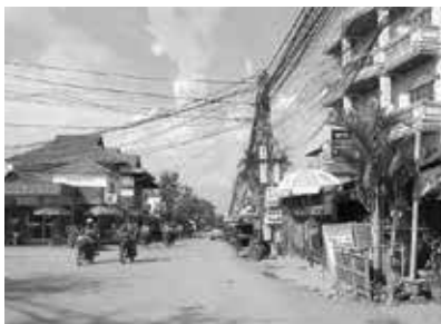
シムリアップ市内

ドになりたいとの事で、今は中国語・日本語の勉強もしたいとの事でした。なかなか良い青年でしたので翌日から3日間のドライブを予約しました。