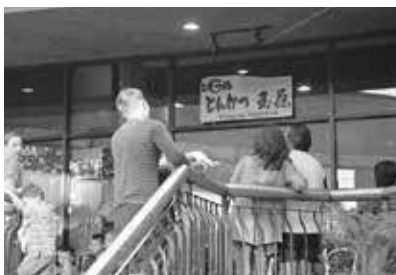
金曜日の夕方5時頃の様子

このお店のとんかつは本当においしいです！創業昭和27年、北海道札幌を中心に展開している老舗のとんかつ専門店ということですが、オープン当初から人気で、1年半経っても、毎日店の外に行列が出来ています。最低