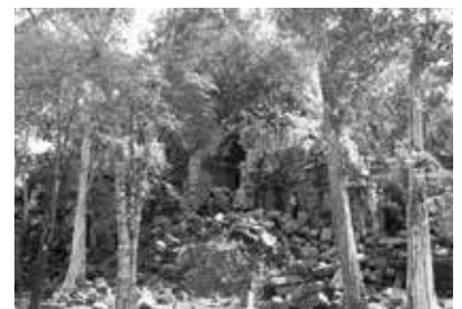
ベン・メリア遺跡