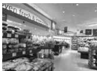
クロワッサンが美味しかった