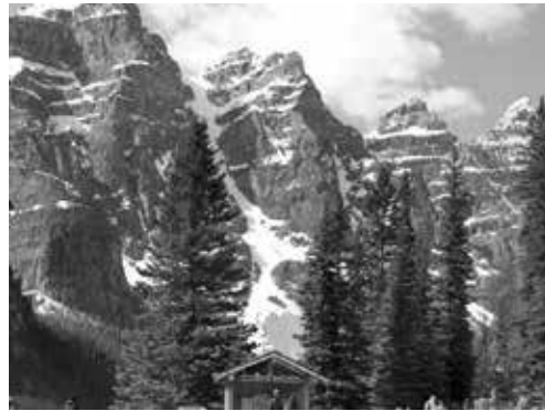
雪のカナディアンロッキー

コロンビア大氷原 3,000m級の山並みが続く。クーレミ湖・ボウ湖・ベント湖と透き通る青い雪溶け水、美しい山並み大氷原にたつ自分に感動する。