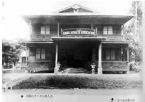
100年前の日本人会館

1月から“先人の功績をふりかえり 未来に夢をはせる”と題して準備を進めてきました。100年近く前に2万人以上の日本人が住