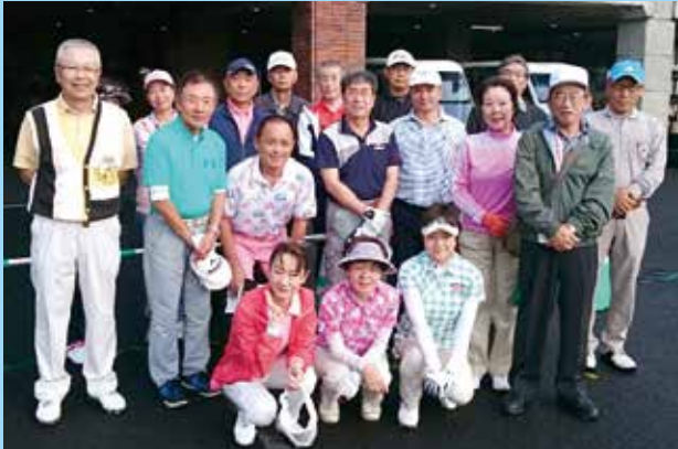
北海道支部 秋のゴルフコンペ