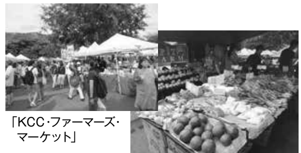
「KCC・ファーマーズ・マーケット」

ハワイ大学にも行って見ました。オリジナルのマーク入りの衣類や帽子などがありますので、若い人への土産には良いです。値段もそんなに高くはなかったですね。