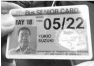
相変わらずの手配写真??!!

シニアカードが10ドルと、ステッカーが6ドルの16ドルで、1カ月乗り放題とはありがたいですね。