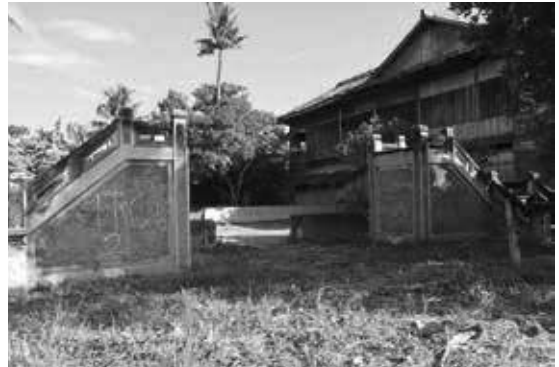
現在の100年前の記念撮影場所